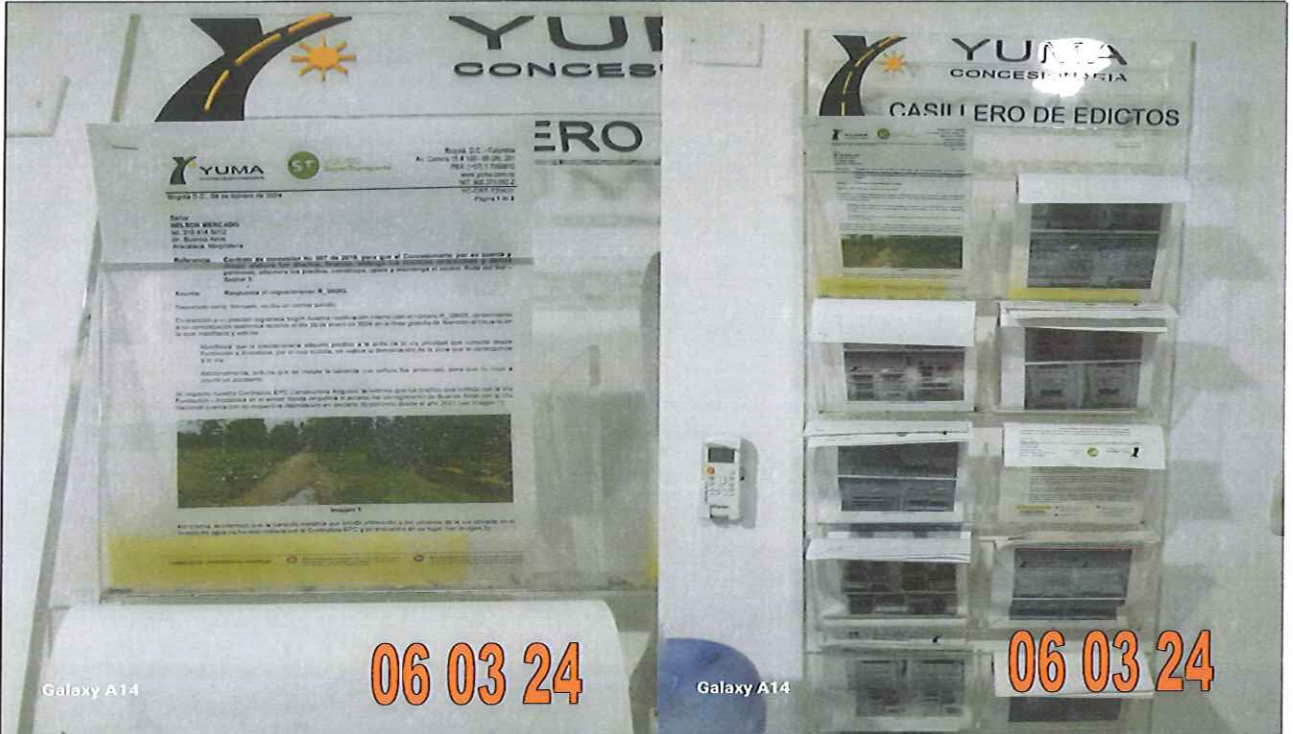
EDICTO R_38663 YC-CRT-135431