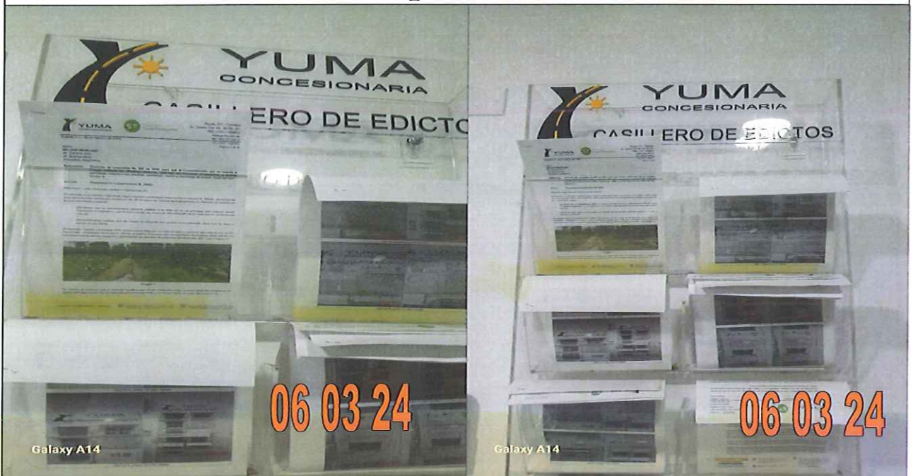
EDICTO R_38663 YC-CRT-135431